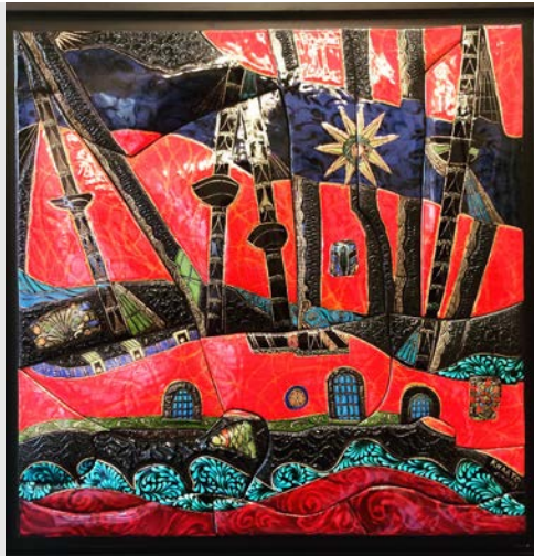
Plein émail