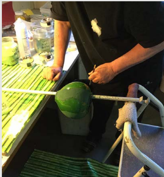
Travail sur une pièce en volume © Pierre CHRISTEL

L'émail sur volume nécessite des gestes et un matériel particuliers. Apparu dès le Moyen Âge, l'émail en volume connaît un regain d'intérêt dans les années 1920 avec les Ateliers Fauré, Marty et Sarlandie. L'émail en volume est surtout utilisé pour la création de vases, emblématiques de la période Art Déco. Aujourd'hui, seuls quelques émailleurs pratiquent l'émail en volume pour des créations résolument novatrices. La technique consiste à recouvrir le volume créé par un dinandier d'une couche de fondant. Le volume est ensuite cuit avant de recevoir une couche de paillon d'argent (ou de cuivre si l'émailleur souhaite jouer avec les effets de la calamine) qui permet des retouches en cas de chute de l'émail lors de la cuisson. Les poudres d'émail, broyées très finement sont alors appliquées en couches épaisses à la spatule ; afin de permettre leur fixation, elles sont mélangées avec de la colle. Le volume est ensuite cuit dans un four électrique : cette cuisson est une étape fondamentale et très précise afin d'éviter toute chute de l'émail dans le fond du volume.