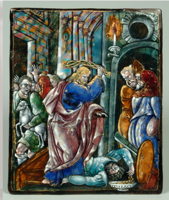
Léonard Limosin, Jésus chassant les marchands du Temple , 1534, émail peint