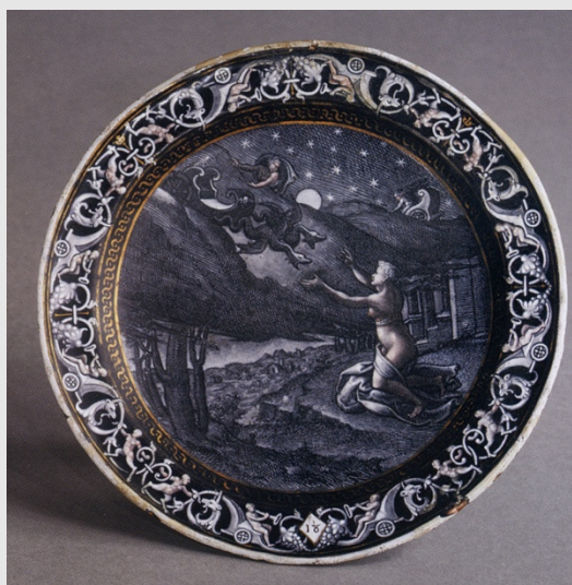
Pierre Reymond, Médée , vers 1568, grisaille