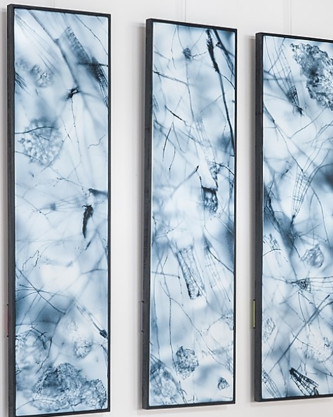
Émail sur acier ©Marie-Hélène SOYER

L'émailleur peut également utiliser le procédé sérigraphique. Les pâtes sérigraphiques sont composées de silices, oxydes métalliques et se diluent à l'essence grasse. Elles cuisent entre 760°C et 780°C. Le résultat offre un aspect brillant et résiste longtemps à toutes les agressions.