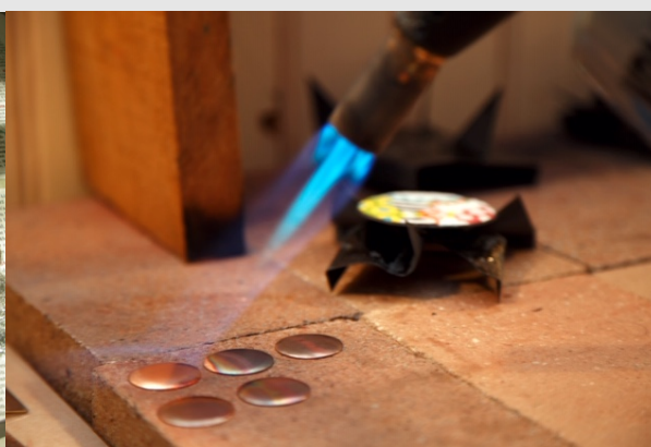
Chauffe de la plaque de cuivre au chalumeau

Dans le cas des supports en cuivre, ceux-ci peuvent être décapés puis dégraissés afin d'éviter l'apparition de calamine (oxyde de cuivre) lors de la cuisson. Il existe plusieurs méthodes de décapage :