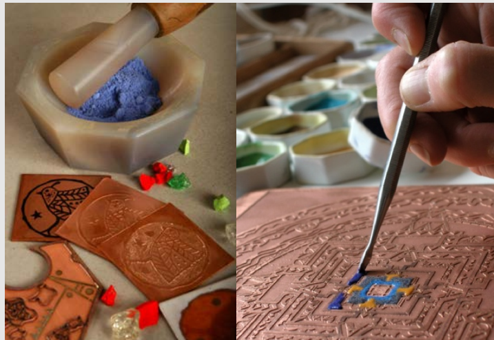
Étapes du champlévé

La technique de l'émail champlévé est l'une des spécialités historiques de Limoges du XII e au XIV e siècle. Très populaire, elle tombe petit à petit en désuétude jusqu'à paraître totalement surannée au XIX e siècle. De nos jours, elle conserve encore cette image vieillotte, quoique les émailleurs et les bijoutiers se la réapproprient de plus en plus.