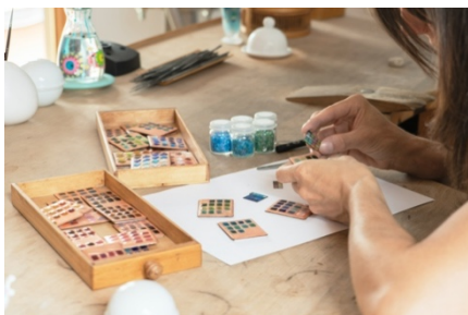
Choix des couleurs de poudre d'émail