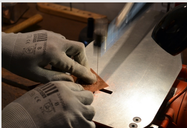
Découpe du cuivre à la scie à chantourné

Pour ce faire, l'émailleur dispose d'une table de bijoutier et d'une scie bocfil. Avant de détourer la forme, il prépare le motif souhaité qu'il peut soit dessiner directement sur la plaque soit coller sur celle-ci après l'avoir dessiné sur un papier. Il détoure en un geste le motif et la forme du support souhaités. La découpe peut alors être utilisée comme pochoir et la forme peut être émaillée.