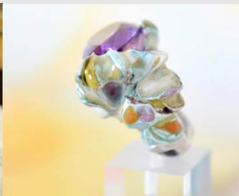
Bague après fonte, émaillage et sertissage