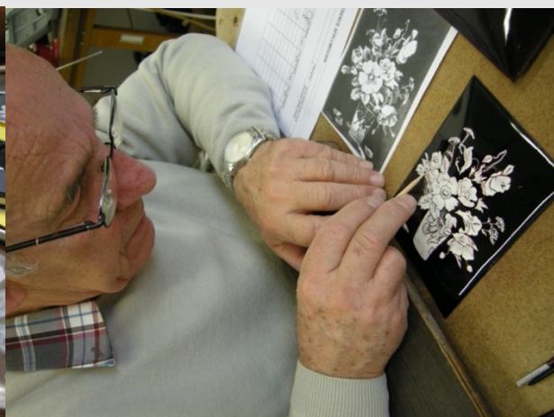
Travail de la grisaille © Cécile CHANCEREL