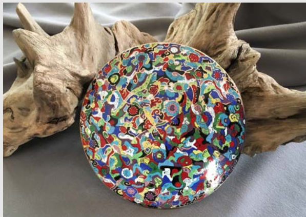
Pièce en champlévé doré

Une fois la pièce gravée et nettoyée, l'émailleur peut y déposer l'émail, le plus souvent opaque et en poudre humide et lui faire subir les cuissons qui permettent de le fixer au métal. La couleur est ainsi cernée par le métal que l'outil a épargné, d'où le nom de « taille d'épargne » qui s'applique également à cette technique. Les couches successives d'émail doivent être légèrement bombées afin de prévenir l'effet d'affaissement de l'émail lors de sa cuisson. La pièce peut ensuite être travaillée sur les parties métalliques mises au jour, avant d'être poncée et polie. Pour finir, elle peut être vernie ou recouverte d'un fondant pour la rendre plus brillante et empêcher l'oxydation du métal. L'émailleur peut également choisir de poser une dorure pour rendre la pièce inaltérable.