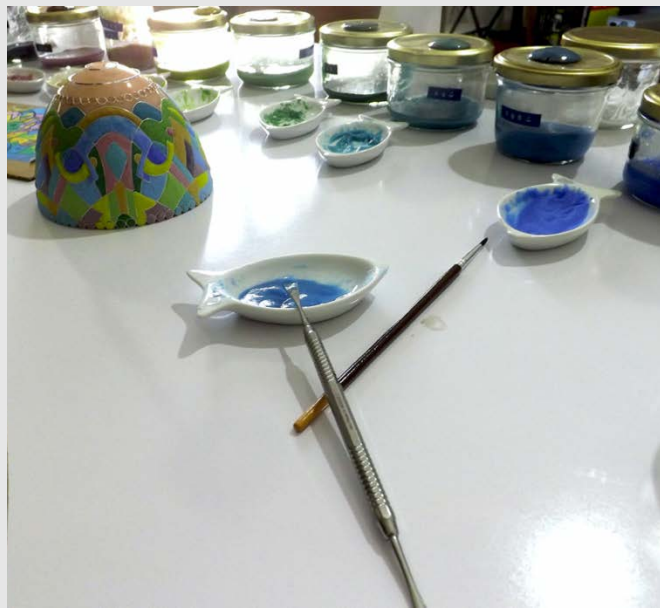
La poudre est mélangée à l'eau avant d'être posée à l'aide d'une spatule.

L'épaisseur de la couche de poudre d'émail posée doit être contrôlée afin d'obtenir le résultat escompté. À chaque technique d'émaillage répond une technique de dépose ( cf. section I.5.3. infra ).