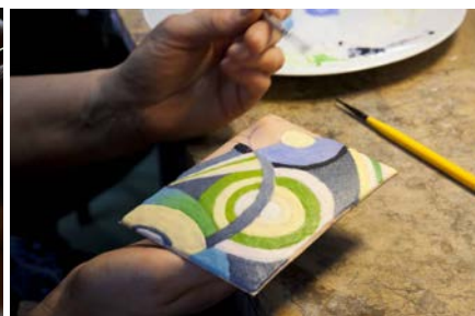
Plaque émaillée avant cuisson