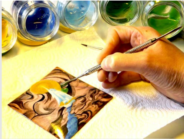
Pose de la poudre sur le support (émail peint)