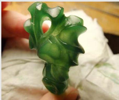
Bague avant la fonte © Aude BRAMOULLE

Le travail de maquette en cire commence par la définition du volume d'enveloppe : à l'aide de râpes, limes et rifloirs, l'émailleur crée le volume définitif. La phase de l'émerisage, qui permet d'adoucir les contours du volume, vient ensuite pour donner la finition la plus précise possible à la pièce. Avant envoi chez le fondeur, il convient d'évider la cire à l'aide de fraises boules et d'une pièce à main sur moteur, étape primordiale pour alléger ce qui devient une pièce en métal, le poids étant une contrainte en joaillerie, tant pour la portabilité du bijou que pour le coût des métaux utilisés. Une fois la cire fondue et le volume en métal obtenu, l'émailleur peut émailler la pièce.