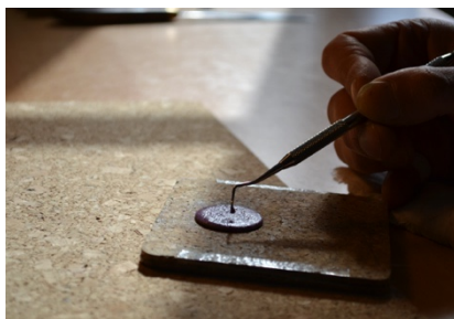
Émaillage à la spatule