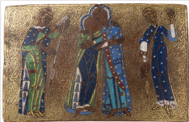
Visitation, vers 1170-1180, émail champlevé

La demande croissante, aussi bien par l'Église que par les Cours européennes contraint les émailleurs à rationaliser et à standardiser leur production : les émaux, fabriqués en série, perdent alors de leur qualité. La production limousine a par ailleurs du mal à se renouveler et ne parvient pas à répondre à la commande d'objets de luxe, volonté d'une société qui se laïcise et s'enrichit de plus en plus. La Guerre de Cent Ans porte le coup de grâce à cet art semi-industriel au cours du XIV e siècle.