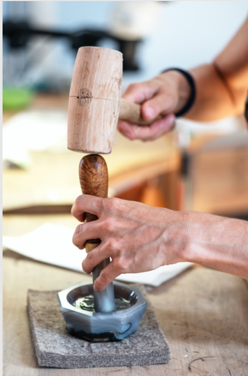
L'émailleur prépare la poudre.

poudre d'émail désirée est versée dans un pot fermé. Le dernier réceptacle recueille les éléments polluants de la poudre tamisée qui peut donner à l'émail un aspect trouble une fois cuit.