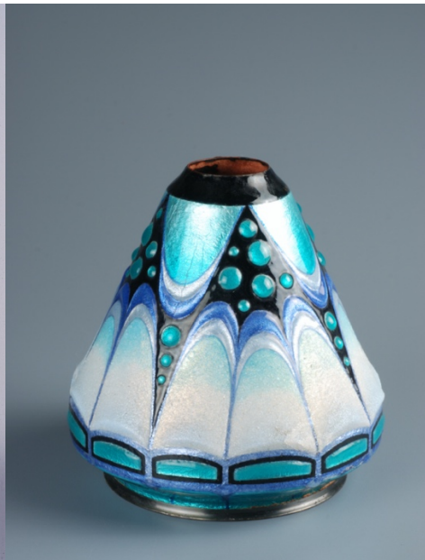
Henriette Marty, Vase , 1930 émail peint sur paillons d'argent