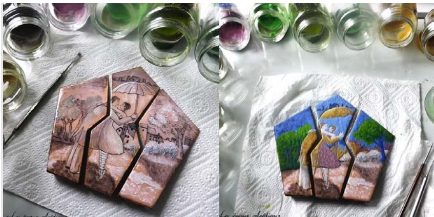
Pluie d'amour , émail peint – tracé © Les émaux Arédiens