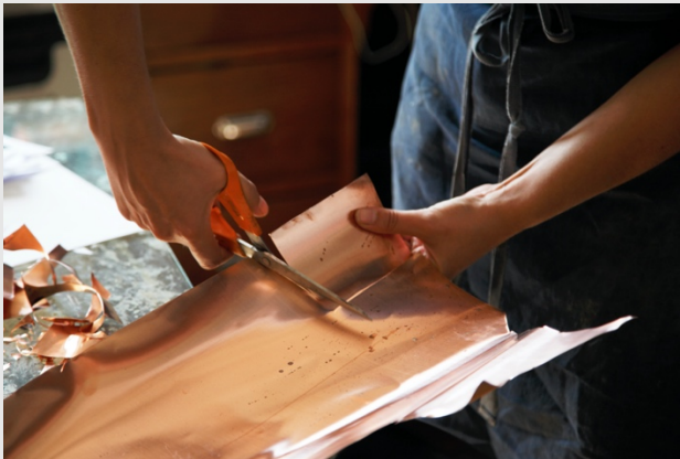
Découpe de la plaque de cuivre

Certains émailleurs découpent eux-mêmes les supports de métal avec lesquels ils travaillent : de cette manière, ils peuvent décider de la forme de leur émail (pleine, complexe ou creuse). Cette pratique permet également de réaliser de faux champlevés (superposition d'une plaque pleine et d'une plaque préalablement découpée), des montages ou d'illustrer des émaux pour donner du relief par fusion de la forme sur le support de l'émail.