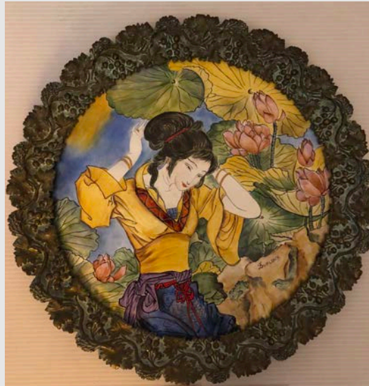
Peinture sur émail – les oxydes vitrifiables sont moins brillants que les émaux transparents.

La plaque est ensuite cuite : avant de l'enfourner, il faut veiller à ce que l'huile ait brûlé. Pour cela, l'émailleur laisse la plaque sécher à l'air libre avant de la placer au-dessus du four. La plaque peut ensuite être enfournée en réalisant des allers-retours afin d'éliminer les dernières traces d'huile et d'éviter l'apparition de flammes. Une fois que la pièce a pris une couleur marron, elle peut être laissée plusieurs minutes dans le four. La cuisson est une étape délicate pour les émaux vitrifiables : lorsque ceux-ci sont trop cuits, le décor disparaît.