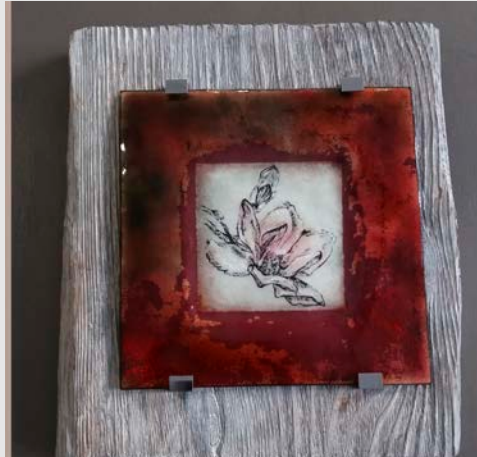
Pièce achevée en rouges de cuivre © Maryse BOUCHET

rouges se perdent si la chauffe est mal maîtrisée et se transforment en orange puis vert bouteille à la surchauffe. La pièce est recouverte de fondant transparent pour les rouges, les oranges, les verts ou les noirs. L'ajout d'une couche d'émail blanc en dernière instance permet d'obtenir une couleur turquoise.