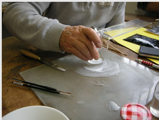
Préparation émail pour grisaille

Dérivée de l'émail peint, la technique traditionnelle de la grisaille au blanc de Limoges consiste à superposer un émail blanc, épais, sur un fond noir parfaitement homogène. Par grattage, à l'aide d'outils extrêmement fins (pinceau ou aiguille) et par cuissons successives, l'artiste obtient une gamme très étendue de gris, qui convient particulièrement à l'art du portrait. À l'inverse de la grisaille moderne, réalisée avec des émaux opales, plus l'émailleur cuit le blanc, plus celui-ci s'estompera au profit du fond noir avec le blanc de Limoges.