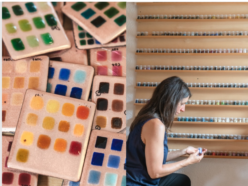
Nuancier, poudres cuites