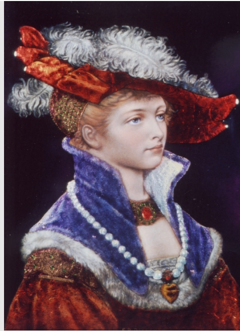
Ernest Blancher, Jeune femme , fin 19e, émail peint

Les émaux du XIX e siècle témoignent d'une technicité parfaitement soignée. Les sujets choisis sont d'inspiration Renaissance et les émaux produits sont la plupart du temps des imitations fidèles de pièces anciennes. L'émail retrouve alors sa popularité : en témoigne la présentation de plusieurs centaines d'émaux lors de l'Exposition Universelle de 1889. Certains artistes vont cependant abandonner les techniques anciennes et explorer de nouvelles façons d'exploiter le matériau, marquant ainsi un tournant important dans l'histoire de l'émail.