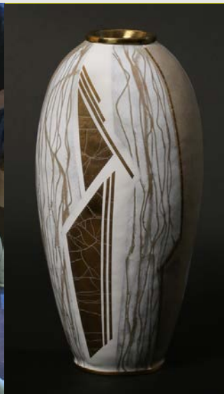
Vase, pièce en volume, 2017 © Pierre CHRISTEL, Dominique FOLLIOU