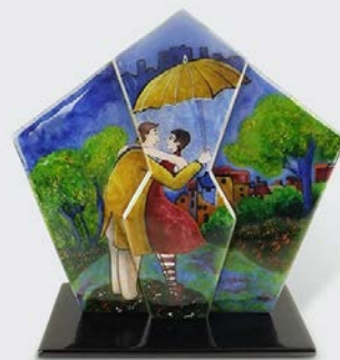
Pluie d'amour émail peint – après cuisson

Dérivée de l'émail peint, la technique traditionnelle de la grisaille au blanc de Limoges consiste à superposer un émail blanc, épais, sur un fond noir parfaitement homogène. Par grattage, à l'aide d'outils extrêmement fins (pinceau ou aiguille) et par cuissons successives, l'artiste obtient une gamme très étendue de gris, qui convient particulièrement à l'art du portrait. À l'inverse de la grisaille moderne, réalisée avec des émaux opales, plus l'émailleur cuit le blanc, plus celui-ci s'estompera au profit du fond noir avec le blanc de Limoges.