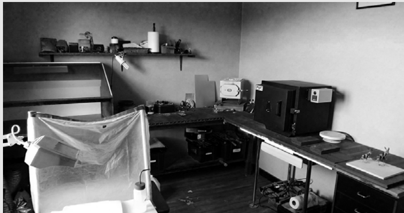
Vue d'un atelier d'émailleur

Quelques ateliers familiaux subsistent, mais ils sont largement minoritaires. La Maison Jeanvoine (émaux bressans), labellisée Entreprise du patrimoine vivant (EPV), occupe le même bâtiment depuis plus de 150 ans : elle est l'un des derniers exemples de ces grandes familles d'émailleurs. La bijouterie abrite les postes de travail de tous les artisans impliqués dans la création des émaux : l'émailleur, le monteur et le sertisseur en particulier.