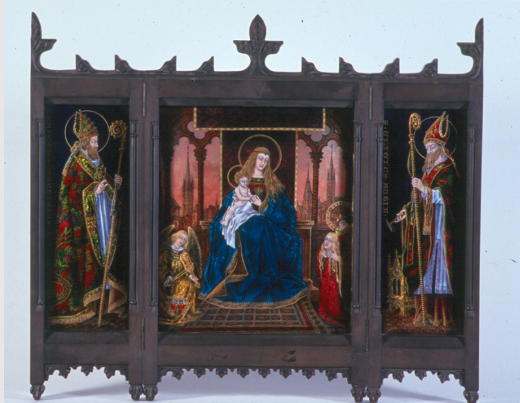
Louis Bourdery, triptyque : Vierge trônant avec sainte Valérie et un ange , 1886, émail peint

Les émaux du XIX e siècle témoignent d'une technicité parfaitement soignée. Les sujets choisis sont d'inspiration Renaissance et les émaux produits sont la plupart du temps des imitations fidèles de pièces anciennes. L'émail retrouve alors sa popularité : en témoigne la présentation de plusieurs centaines d'émaux lors de l'Exposition Universelle de 1889. Certains artistes vont cependant abandonner les techniques anciennes et explorer de nouvelles façons d'exploiter le matériau, marquant ainsi un tournant important dans l'histoire de l'émail.