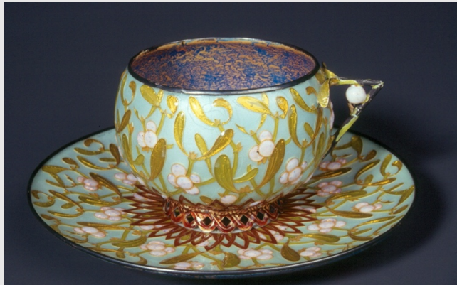
Fernand Thesmar, Tasse et sous tasse au gui , 1893, émail cloisonné © Musée des Beaux-Arts de Limoges

Vers 1900, sans doute sous l'influence de l'École nationale d'arts décoratifs de Limoges, des peintres sur porcelaine optent à leur tour pour l'émail, souvent en complément de leur activité principale. Les premiers vases inspirés de décors céramiques (Paul Bonnaud) et les premiers tableaux de genre (Jules Sarlandie ou encore Alexandre Marty) font alors leur apparition. Les émailleurs commencent également à travailler la matière émail en tant que telle et abandonnent progressivement les représentations traditionnelles, à l'instar des créations de Léon Jouhaud, surnommé le « magicien de l'émail ».