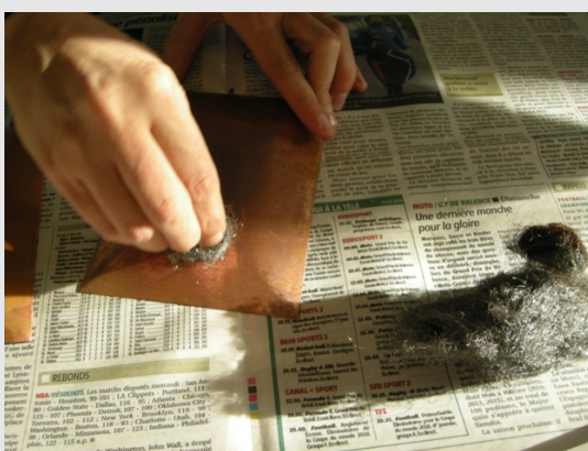
Préparation de la plaque de cuivre

Une fois le support découpé, il peut ensuite être nettoyé, dégraissé, et essuyé pour permettre une meilleure adhésion des poudres d'émail et des colles. Le métal est nettoyé à l'eau claire. Il est ensuite dégraissé à l'aide de soude ou de liquide vaisselle que l'émailleur frotte énergiquement sur le métal à l'aide d'une brosse. Celui-ci essuie ensuite le support avec un chiffon doux. Le dégraissage peut également être réalisé à l'aide de papier émeri. La plaque est ensuite chauffée une première fois au chalumeau ou au four, puis trempée dans l'eau en sortie de chauffe. Une fois refroidie et séchée, la pièce est à nouveau chauffée. Afin de savoir si le métal est bien dégraissé, l'émailleur dépose de l'eau ou de la colle à la surface du support : si celles-ci se répartissent uniformément à la surface de l'eau, le support est suffisamment dégraissé.