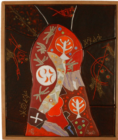
Pièce achevée en cloisonné © BESSETTE