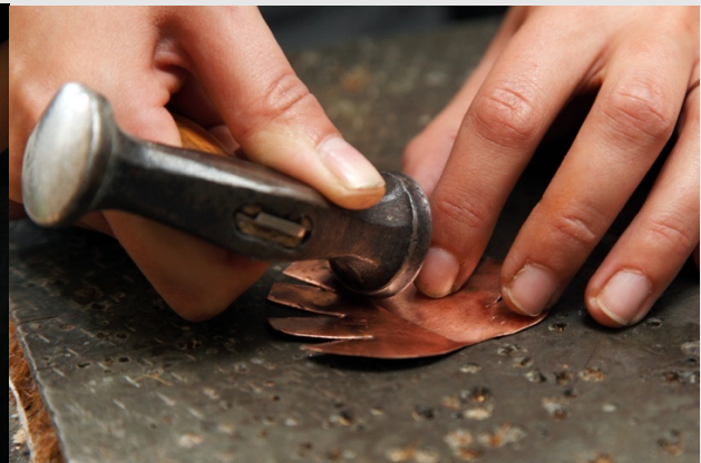
Mise en forme du cuivre