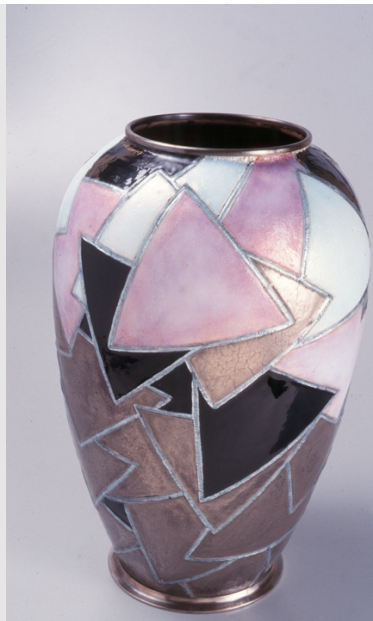
Camille Fauré, Vase , 1941, émail peint