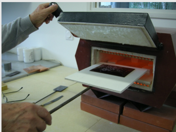
Enfournement de la pièce

Le principe de l'émail est de répéter autant de fois que nécessaire les étapes de la dépose et de la cuisson afin d'obtenir la pièce définitive. Certaines pièces peuvent subir plus de 30 cuissons différentes.