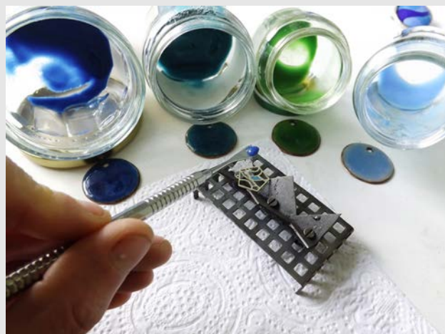
Geste de l'émail plique-à-jour