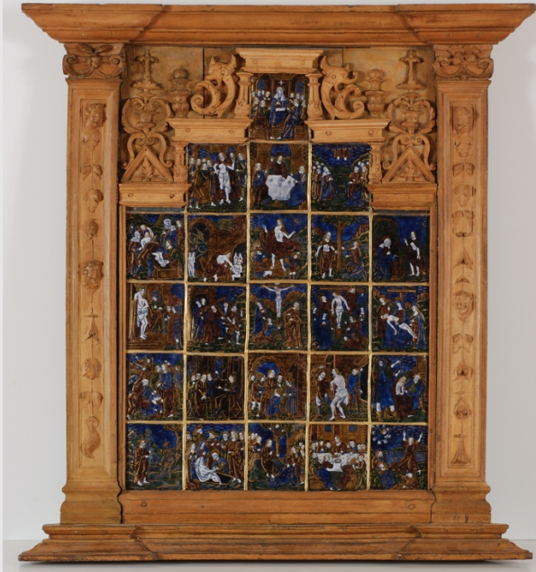
Maître du retable de Mesnil-sous-Jumièges, Retable de la Passion, vers 1520, émail peint. Inspiré de la Passion et de la Petite Passion de Dürer (1508-1512)

L'émail limousin connaît sa première renaissance dès 1480 avec le développement encore obscur d'une technique renouvelée : l'émail peint. Cette production de monopole, qui se développe en parallèle de l'épanouissement de la peinture en Europe, connaît à nouveau une diffusion très large. Les émaux peints sont utilisés à des fins religieuses : ornés de scènes bibliques ou évangéliques, ils s'inspirent principalement des gravures rhénanes et parisiennes. À partir de 1530, comme dans tous les arts de la Renaissance, le répertoire iconographique des émailleurs s'élargit pour intégrer des scènes profanes et mythologiques. Les émailleurs, qui n'inventent pas leurs propres compositions, s'inspirent et transposent des gravures et des peintures de l'époque. L'apparition des émaux peints et de la grisaille de Limoges est certainement liée à cette pratique de la transposition.