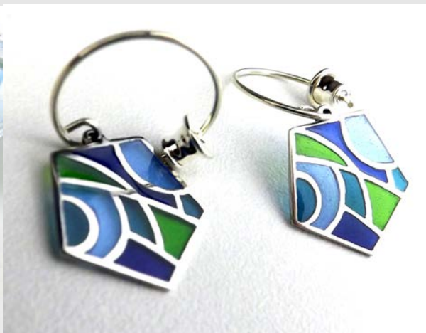
Pièce achevée en plique-à-jour